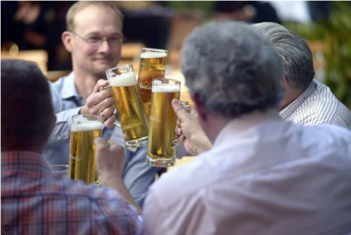
Neubiberger Gemütlichkeit: Bier, Bar und BBQ beim 6. Alumni-Kongress an der UniBw München